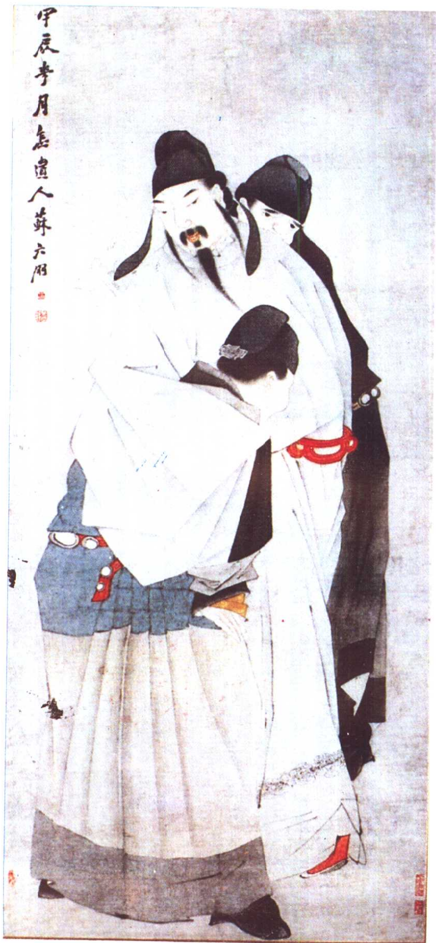
醉太白图 清·苏六朋