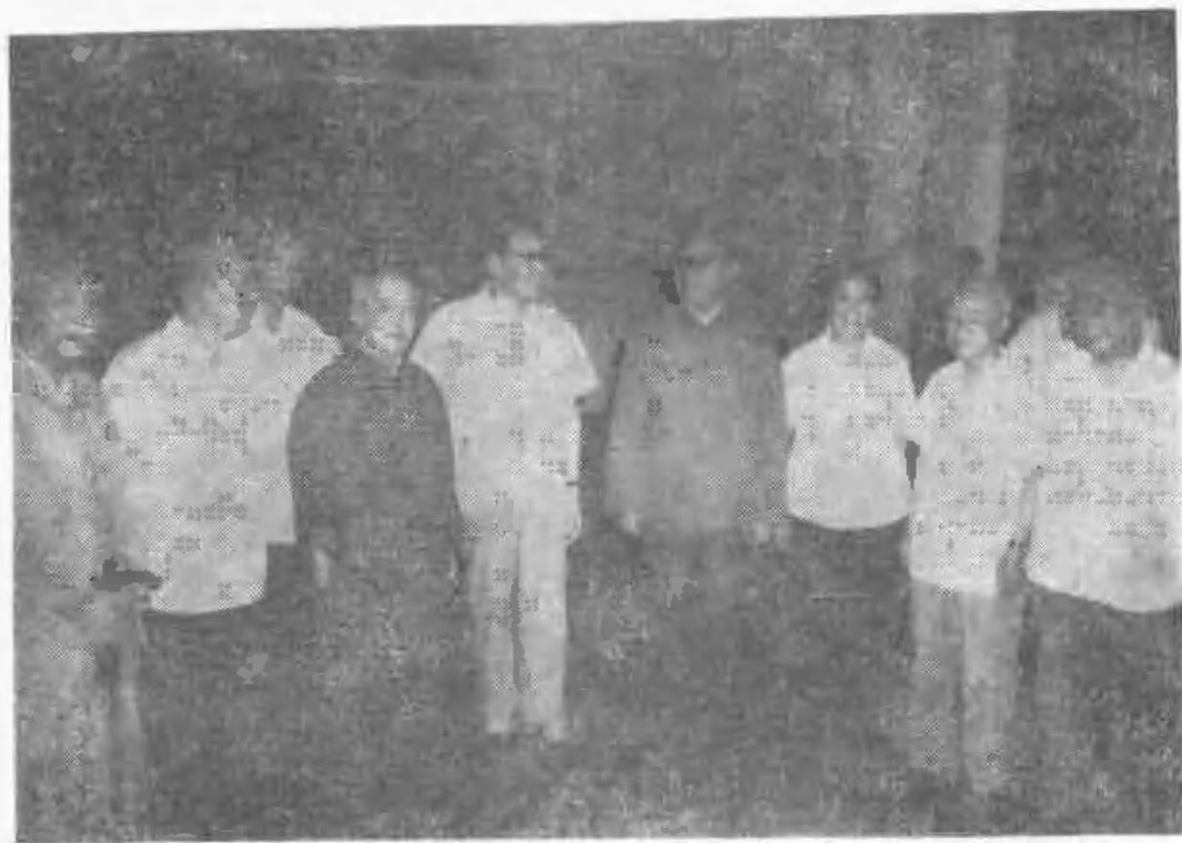
1980年在祝寿会前的休息室里